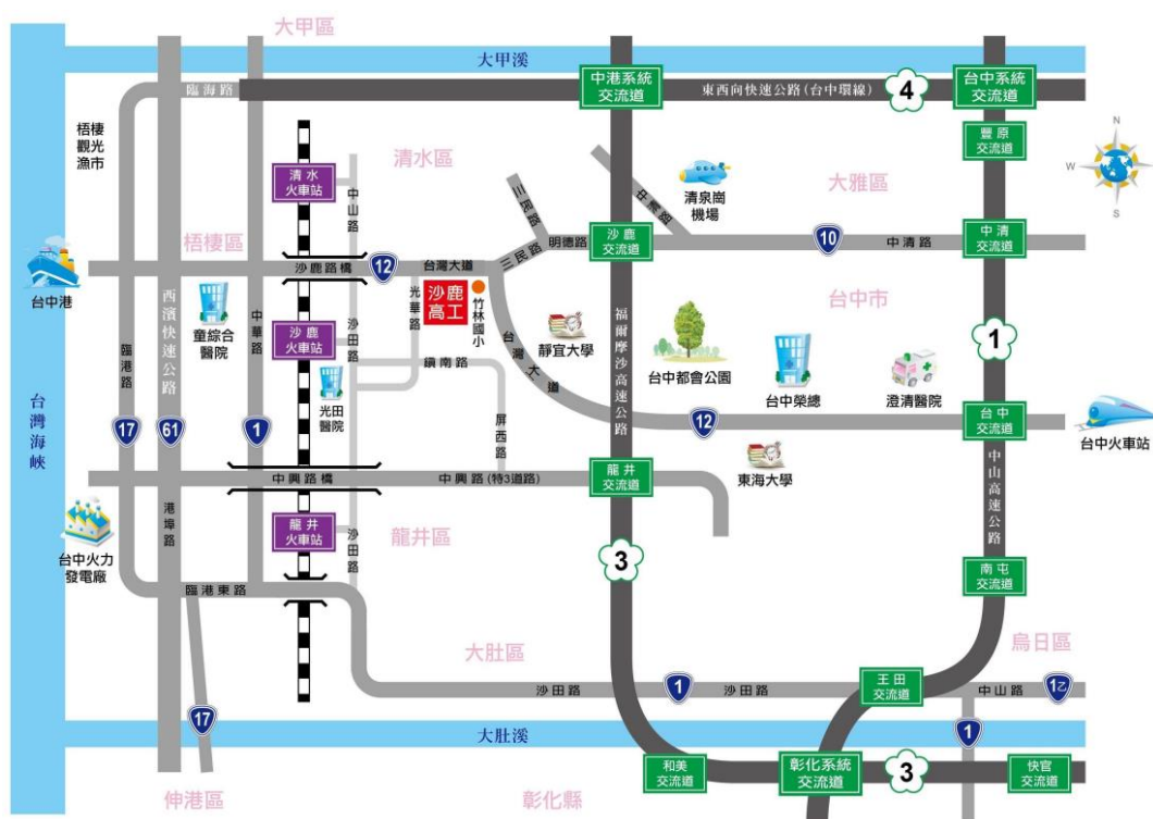
附圖一承辦學校（臺中市立沙鹿工業高級中等學校）位置圖